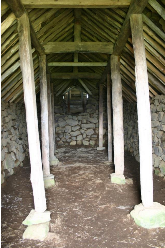
Séð inn í eystri hlöðuna. GLH 2005.