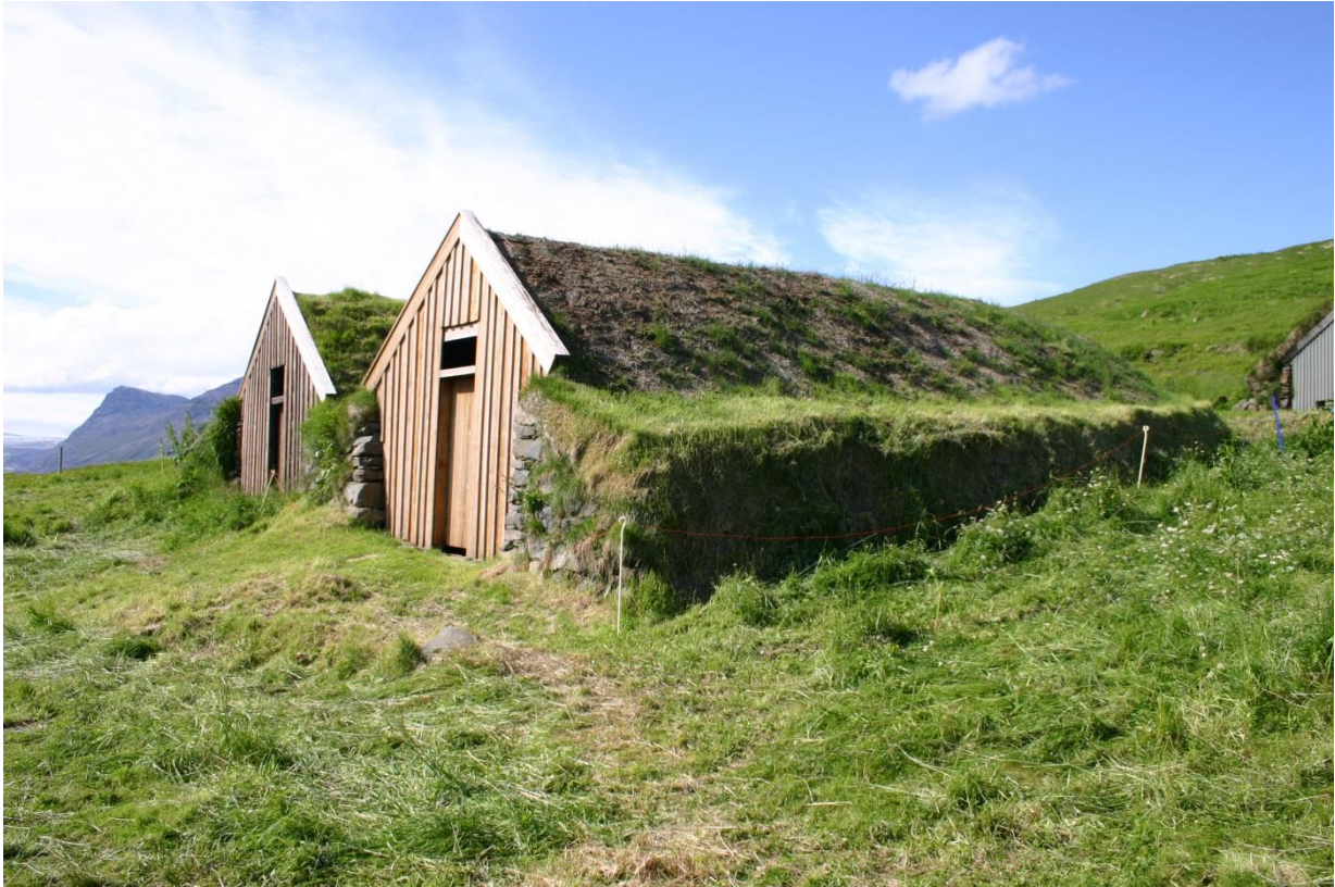
Hlöður í Selinu í Skaftafelli. GLH 2005.