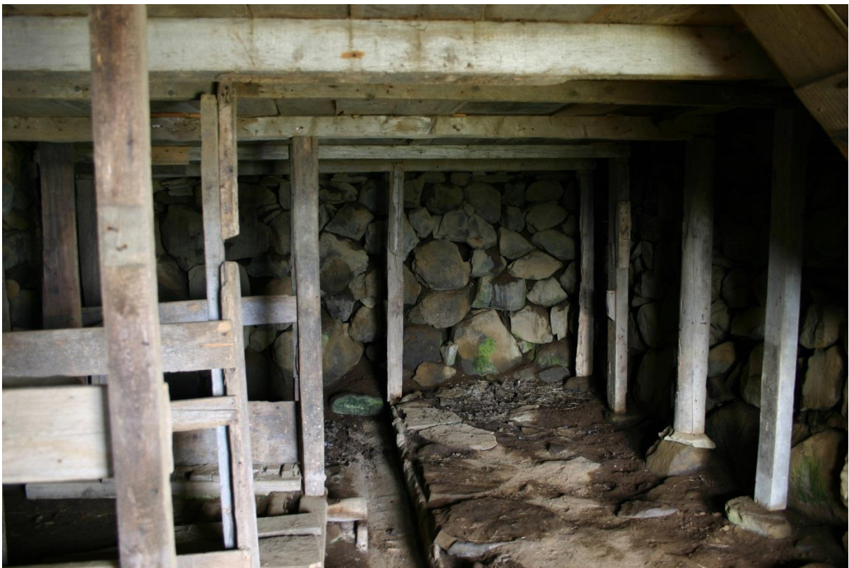
Fjós undir baðstofu. GLH 2005.