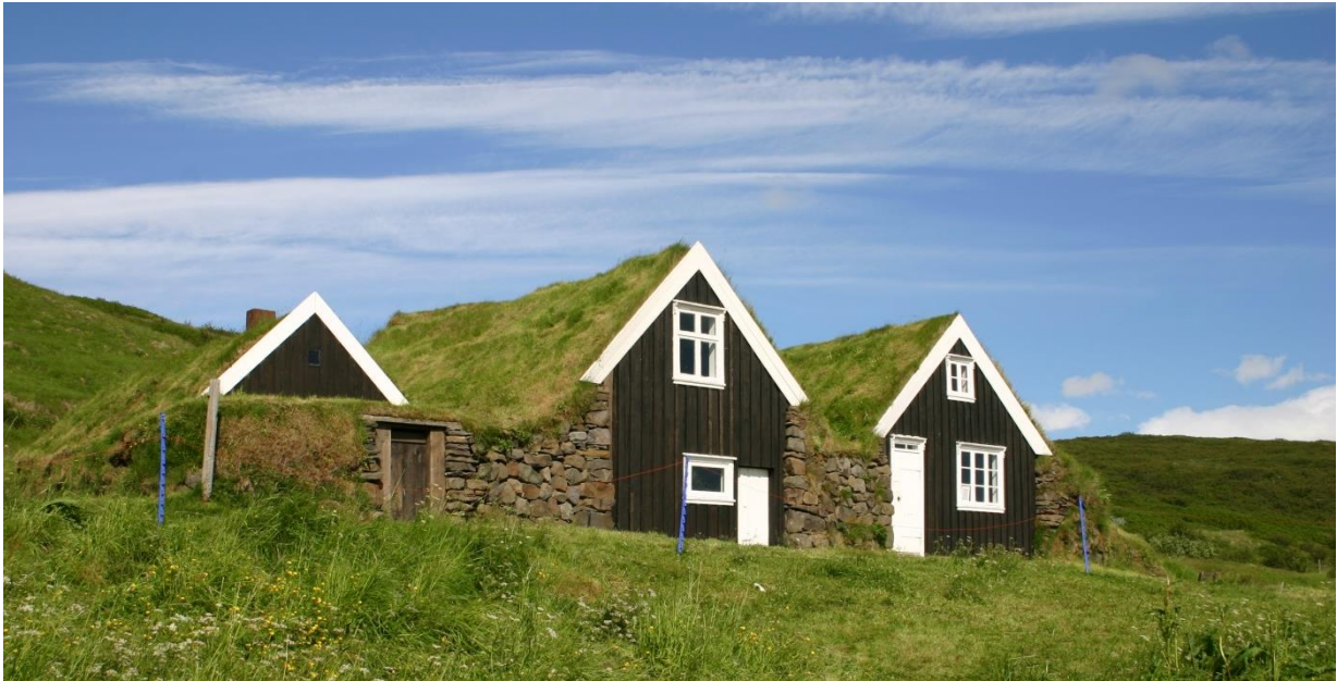
Selið í Skaftafelli. GLH 2005.