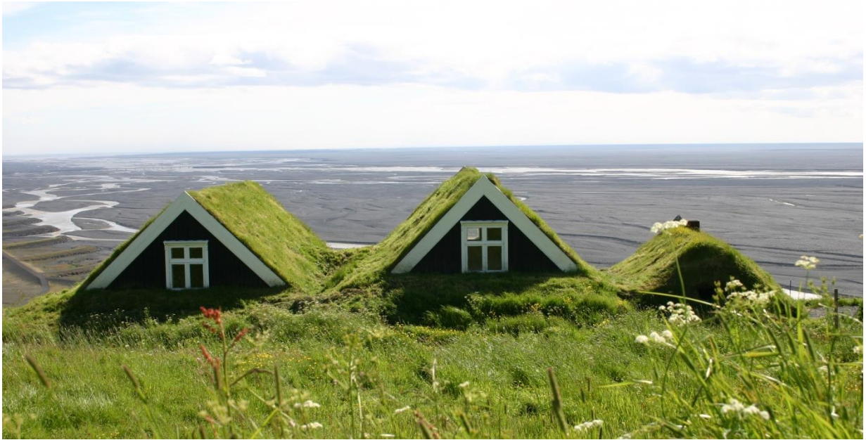
Selið í Skaftafelli. GLH 2005.

bakhlið, þverbitar og sperrur yfir með langböndum og hellum.